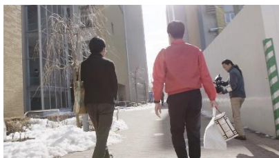
▼突然渡されたお弁当にきょとんとした表情のお兄さん