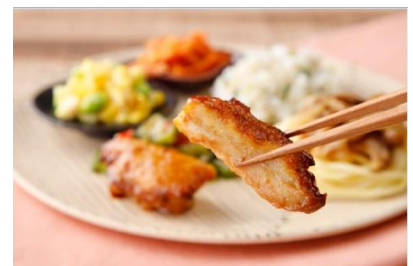
ウーディッシュ ® 鶏肉の味噌だれと和風きのこパスタ