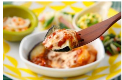
気くばり御膳 ® なすとポテトのミートソースセット