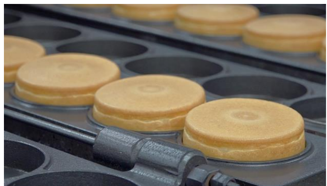
長崎工場 増強ラインのイメージ