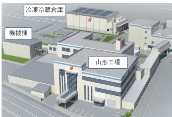
山形工場 完成想定図